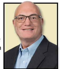
David Kershner Buck Global LLC

The funded status of the Plan at a particular point in time can increase or decrease depending on these factors. Regardless of changes in the funded status from year to year, the Plan’s funding policy adopted by the Board is intended to ensure there will be sufficient assets in the Trust to pay all promised benefits to participants and their beneficiaries.