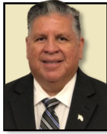
Rep. Joe Molinar District 4

For more information on the cost of living increase, please see page 2.