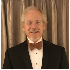
Paul Erlendson Callan LLC

El Fideicomiso de jubilación fue establecido por la Ciudad de El Paso para proporcionar a los participantes beneficios de jubilación. Está regulado por el Código Municipal de El Paso y administrado por la Junta de Fideicomisarios "la Junta". La Junta administra el Fideicomiso de Retiro y, con la orientación de los consultores de